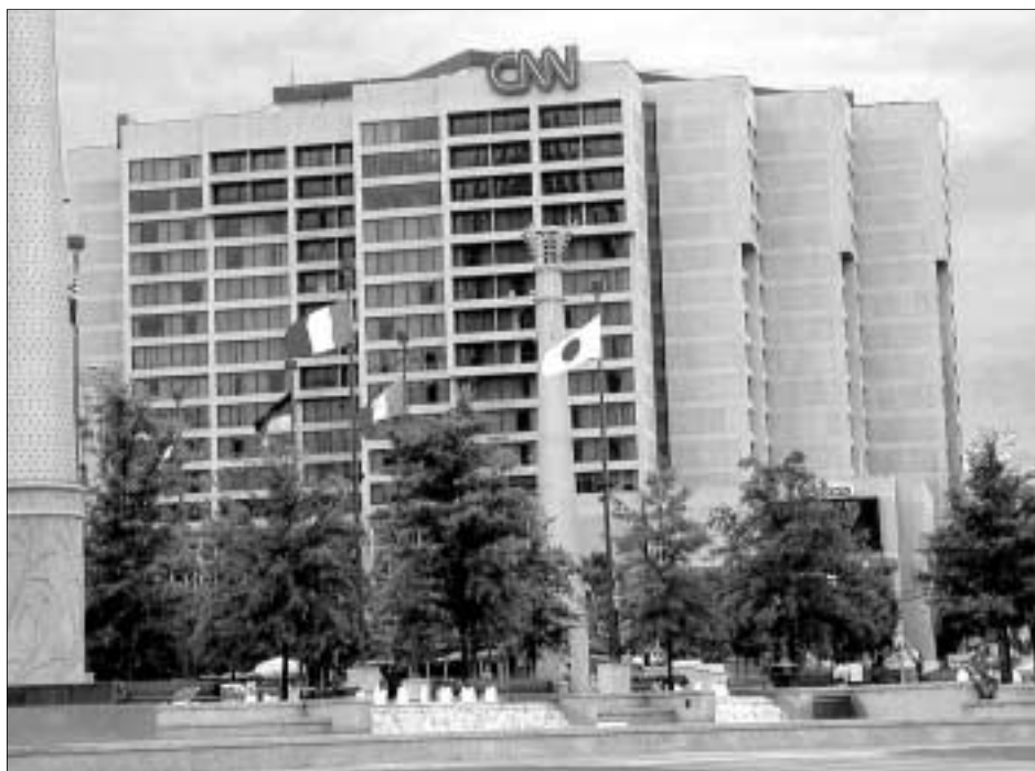
La cadena televisiva CNN lanzó hace cinco años un canal en español para el público hispano.

la edición hispana de Foreign Policy , afirma que, en Miami, las familias que sólo hablan español tienen unos ingresos medios de 18.000 dólares; las que sólo hablan inglés, de 32.000; y las bilingües, de 50.000 dólares.