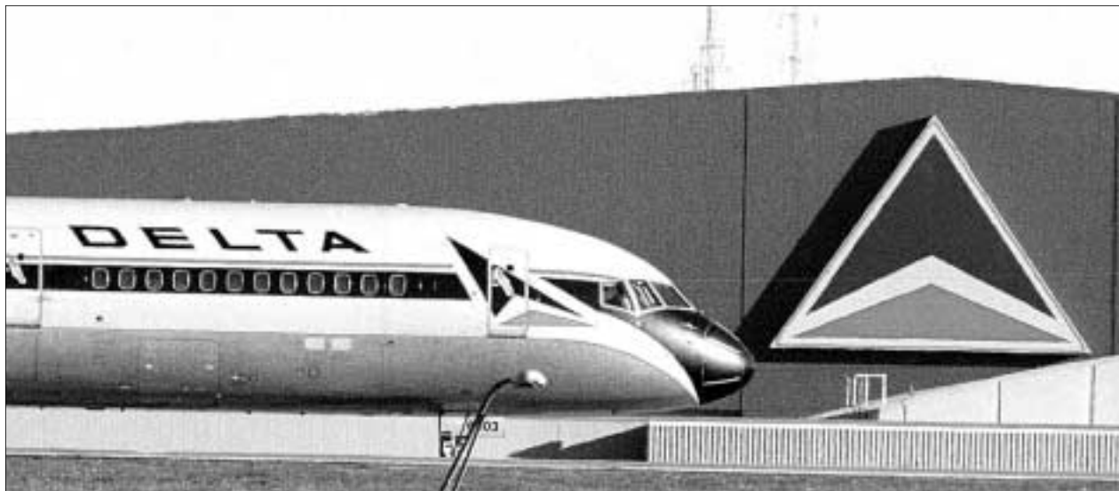
Delta es la compañía que más tráfico genera en el aeropuerto de Atlanta, centro que cada año usan 80 millones de personas entre las dos Américas.

Delta, por ejemplo, participó en el Congreso Sumaq para subrayar su interés por este mercado, ya que es la compañía que más tráfico genera en el aeropuerto de Atlanta, “un centro que utilizan cada año 80 millones de pasajeros para unir Latinoamérica con Estados Unidos, frente a los 30 millones que se conectan a través de Miami”, explica Peck.